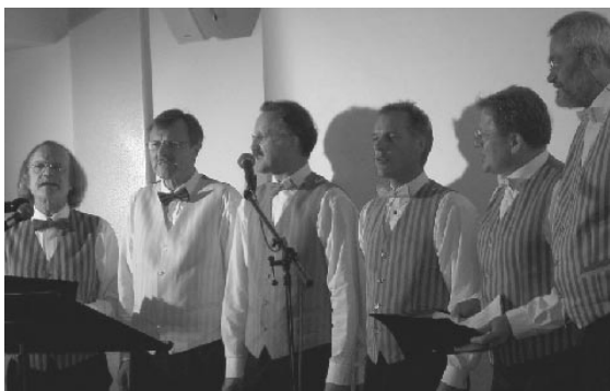
Chor der Berufsschullehrer