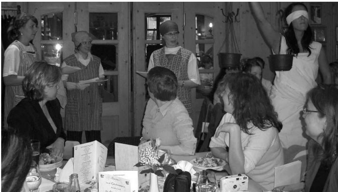
Abschlussfeier der Rechtsfachwirtinnen am 8. Juli 2005 im Münchner Gasthaus »Zum Spöckmeier«